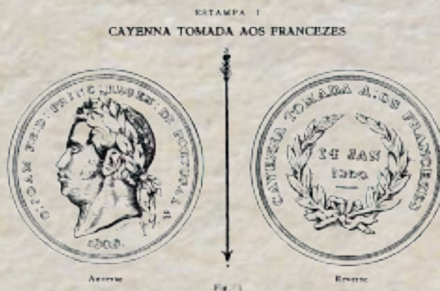
Figura 01: Ilustração da medalha da vitória na Tomada de Caiena, frente e verso.