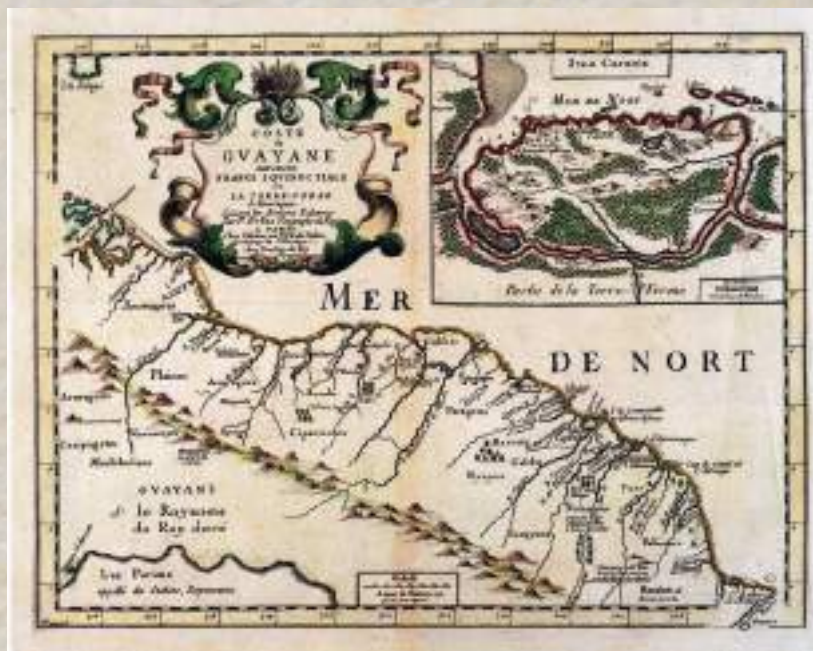
Mapa 01: Mapa de Jean Richer da região das Guianas, feito em 1677.