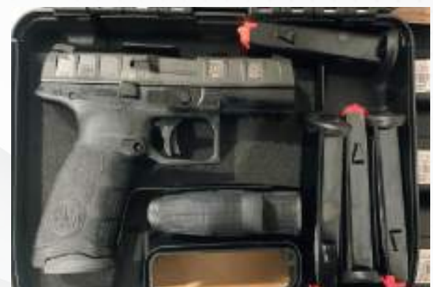
Novas Pistolas Beretta