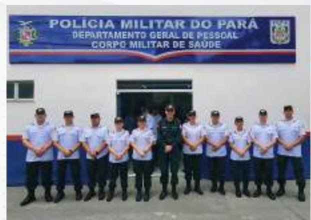
Corpo Militar de Saúde