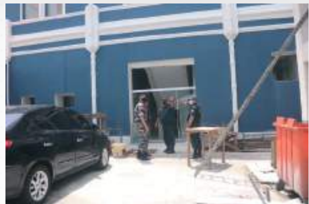
Obras de Reforma do CME