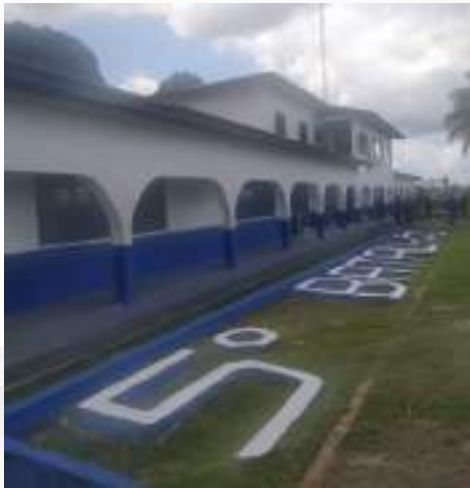
5º Batalhão Castanhal.

Foram empregados R$ 4.790.099,67 (quatro milhões, setecentos e noventa mil, noventa e nove reais e sessenta e sete centavos) na manutenção de diversas instalações de Unidades Policiais, como: 5º Batalhão (Castanhal), totalizando o valor de R$ R$ 342.723,44 (trezentos e quarenta e dois mil, setecentos e vinte e três reais e quarenta e quatro centavos), 35º Batalhão (Santarém), cujo valor foi de R$ 24.402,49 (vinte e quatro mil, quatrocentos e dois reais e quarenta e nove centavos) e do Corpo Militar de Saúde (Belém), que teve valor correspondente a R$ 744.444,31 (setecentos e quarenta e quatro mil, quatrocentos e quarenta e quatro reais e 31 centavos).