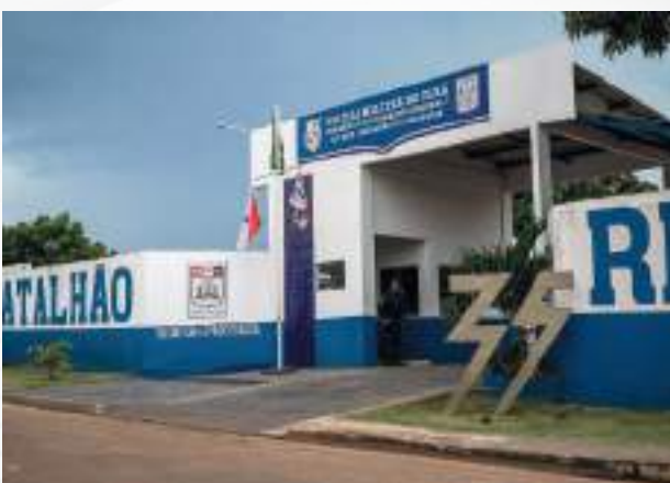
35º Batalhão Santarém.