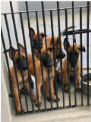
Ninhada Pastor Belga Malinois