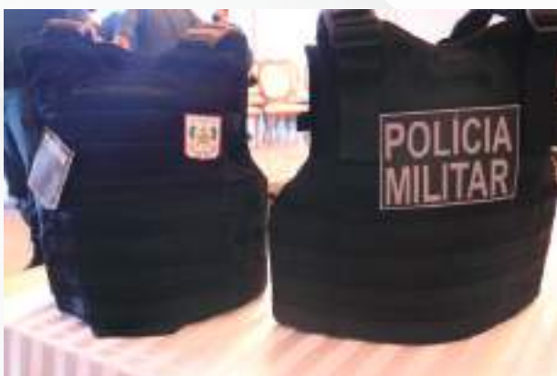
Novos Coletes Balísticos