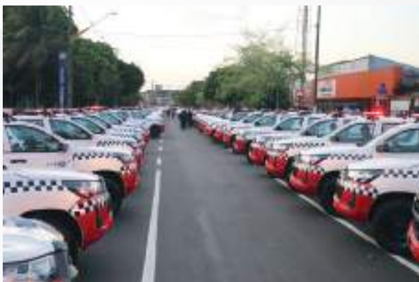
Aquisição de Novas Viaturas

Em 2022, a Polícia Militar empregou recursos financeiros em contratos de locação de viaturas, construção, reforma e manutenção de Unidades Policiais, fornecimento e gerenciamento de combustível, contrato de locação de imóveis, aquisição de mobiliários para garantir a capacidade operativa das Unidades, serviço de telecomunicação e transmissão de dados, aquisição de armamento, entre outros. Isso reforça o compromisso de proporcionar aos policiais militares lotados nos 144 municípios do Estado condições mais adequadas ao desempenho da atividade, primando por qualidade e segurança.