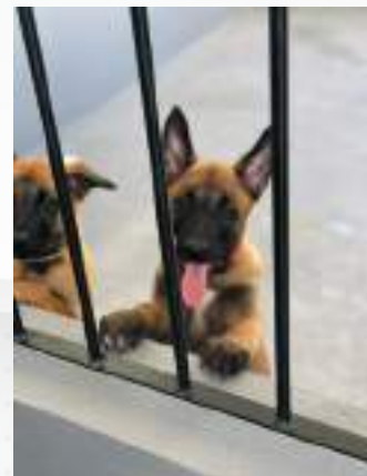
Ninhada Pastor Belga Malinois

Em continuidade à demonstração de ações voltadas para a adequação de Unidades Policiais, conforme o PPA 2020-2023, concretizou-se a entrega dos seguintes quartéis, como resultado de reforma ou construção: