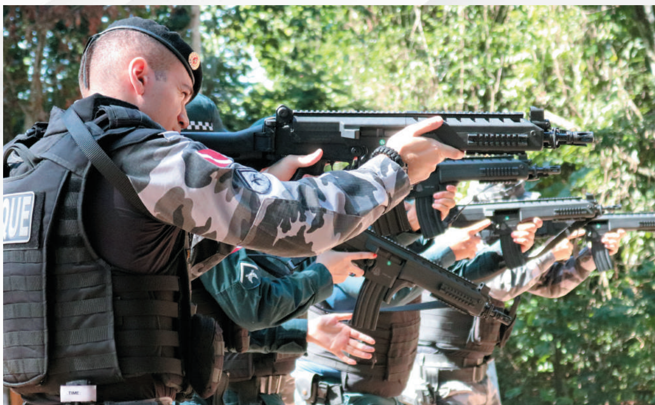
Comando de Policiamento da Capital 1

A Operação Orverlord – Armas Longas, ocorrida no dia 15 de outubro de 2021, atuou no reforço do policiamento em todo o Estado, na busca de ampliar a ostensividade e garantir a segurança da população paraense, envolvendo os comandos da capital, da Região Metropolitana e os comandos regionais com a tropa do efetivo administrativo, em complementação ao efetivo ordinário em todas as modalidades de policiamento.