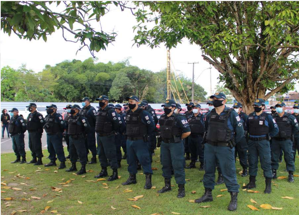
Operação Polícia Mais Forte.

Em 2019, a Operação iniciou com 68 viaturas em quatro municípios do Estado, ao final do ano, evoluiu para 117 viaturas, atuando em 10 municípios e 1 Distrito. Em 2020, foram empregadas 156 viaturas em 26 municípios e 1 Distrito. Em virtude dos resultados positivos, em 2021, foram empregados 586 policiais militares, em 197 viaturas, realizando patrulhamentos em 52 municípios e 1 Distrito. Essa operação reforçou o policiamento ordinário diariamente, das 17h às 23h.