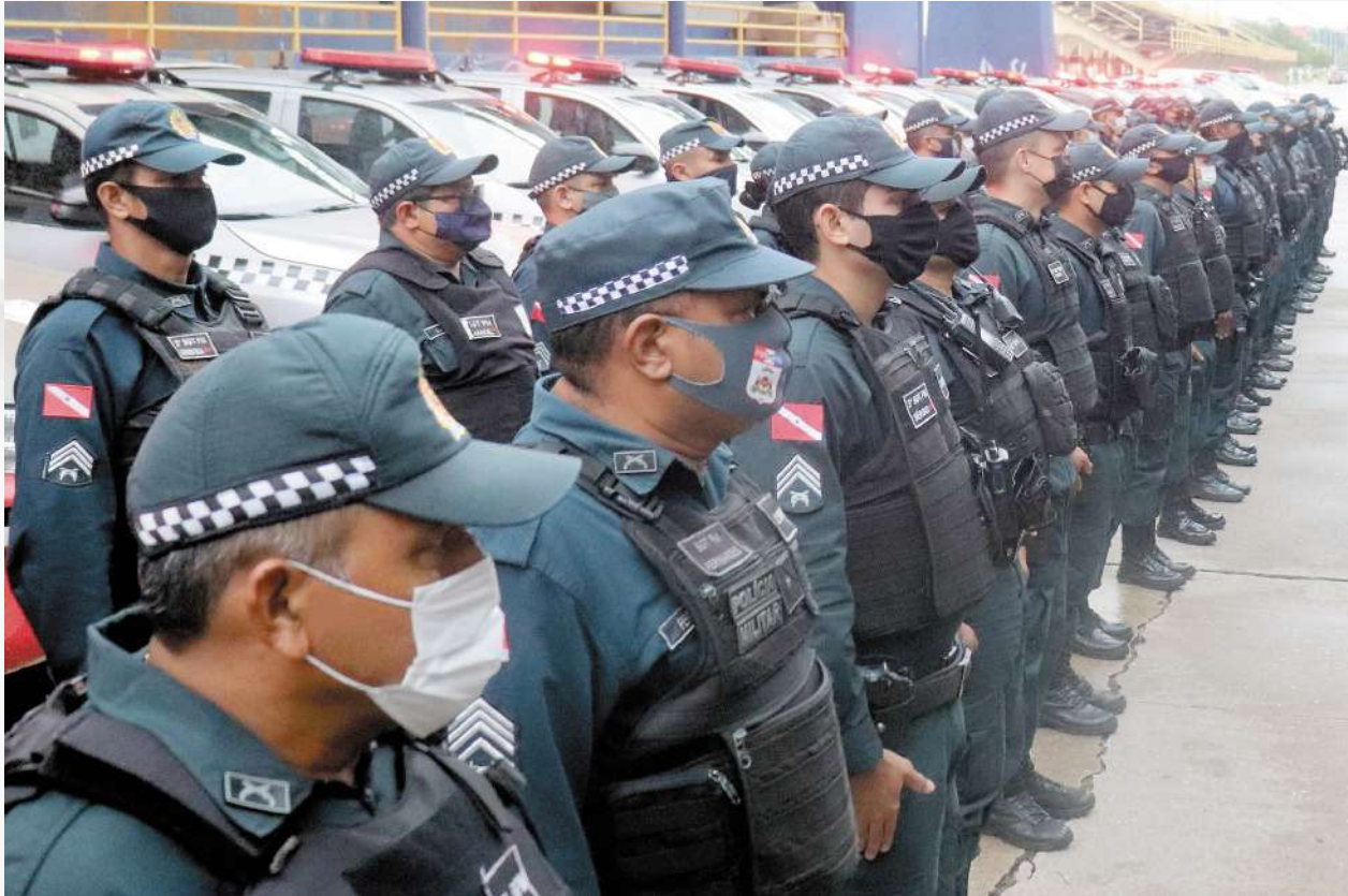
Comando de Policiamento da Região Metropolitana.

A operação consiste no empenho de viatura e do efetivo administrativo do Comando Geral, por meio da Companhia de Comando e Serviço- CCS/QCG, em reforço ao policiamento da capital e Região Metropolitana de Belém.