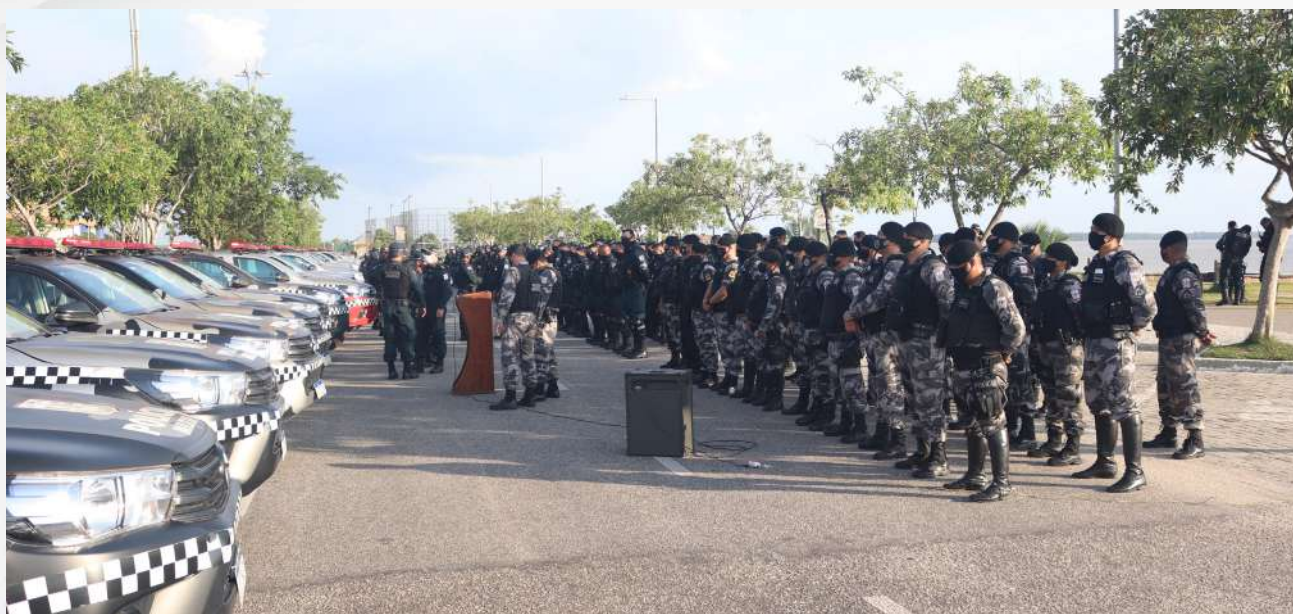
Tropa em forma para operação Overlord.

Foram colocadas 1.322 viaturas à disposição da população paraense, quebrando o recorde também na região metropolitana com 622 viaturas empregadas, somando efetivo entre serviço ordinário e extraordinário de 3.346 homens em todo o Estado.