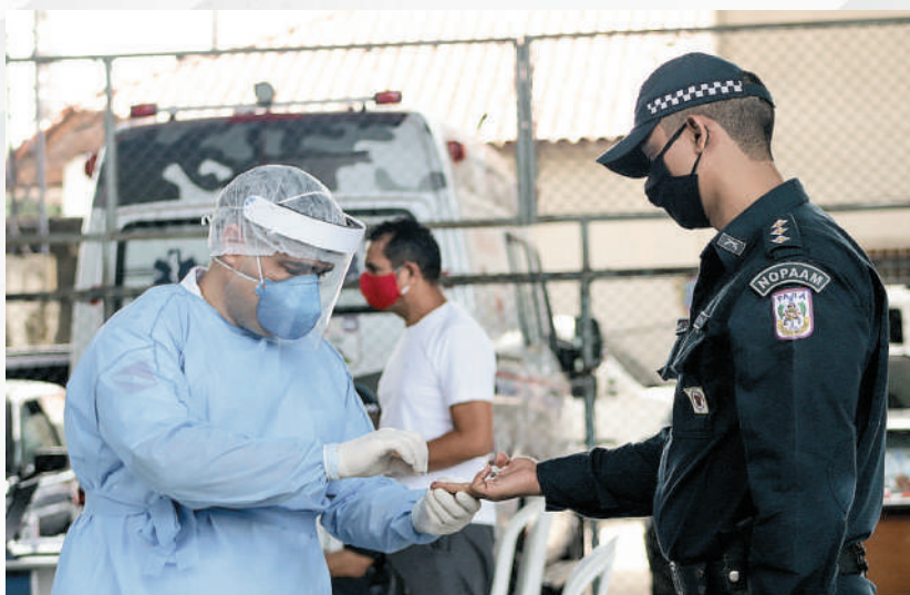
CMS realizando teste rápido de Covid-19 em policiais militares, Belém/PA, 2020.

Em janeiro de 2021, a PMPA iniciou a Operação Covid-19, para prestar apoio policial à SESPA nas escoltas das vacinas que chegavam ao aeroporto de Belém e foram distribuídas nos 144 municípios do Estado. Além das escoltas, a Polícia Militar realizou também ações de combate à Covid-19 em todo o Estado, com o intuito de intensificar as fiscalizações e garantir o cumprimento das medidas sanitárias que visavam o combate à pandemia.