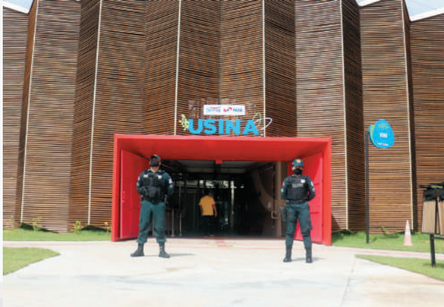
Inauguração da 1ª Usina da Paz, em Ananindeua.

A Usina da Paz (UsiPaz) é um projeto integrado ao programa estadual Territórios pela Paz (TerPaz), elaborado pelo Governo do Pará e coordenado pela Secretaria Estratégica de Articulação da Cidadania (SEAC), em parceria com a iniciativa privada.