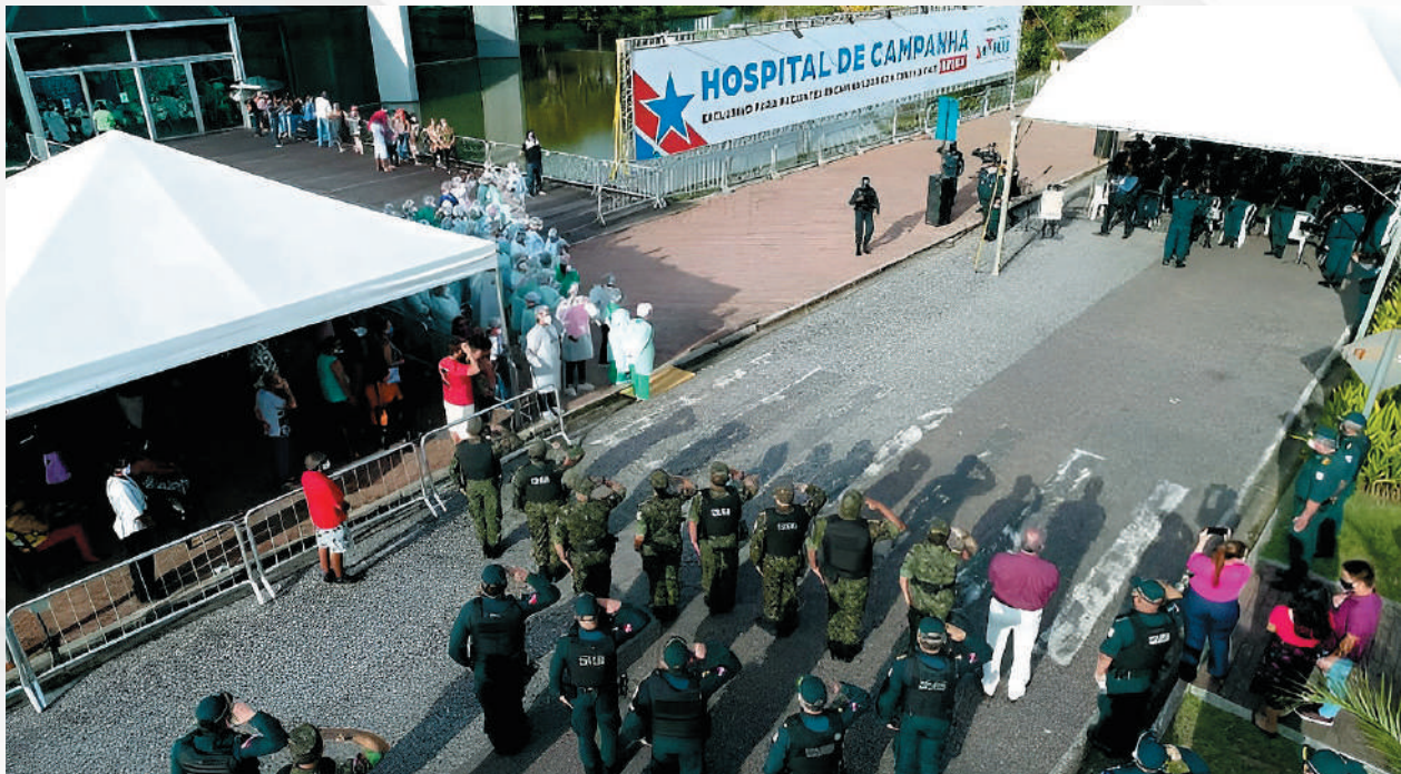
Policiais militares homenageiam os servidores do Hospital de Campanha em Belém.