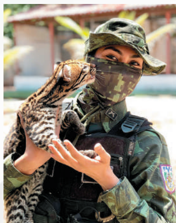
Resgate de animal silvestre.

em todo o Pará, além da 1ª Companhia Independente de Polícia Ambiental (1ª CI-PAMB), sediada em Santarém. O objetivo é apoiar os órgãos ambientais em ações de prevenção e repressão às agressões ao meio ambiente e seus componentes, sobretudo, a crimes que envolvem exploração ilegal de madeiras, em especial com uso de serrarias clandestinas, e queimadas ilegais, situações muito recorrentes nos estados da região amazônica.