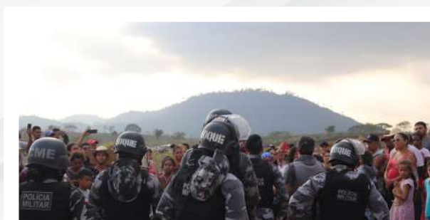
Reintegração de posse - PMPA, 2021.

Em 2021, houve uma redução dos cumprimentos dos mandados de reintegração de posse devido à Arguição de Descumprimento de Preceito Fundamental n.º 828, de 06 de março de 2021, determinada pelo Supremo Tribunal Federal (STF), em que ficaram suspensos todos os processos, procedimentos ou qualquer outro meio que