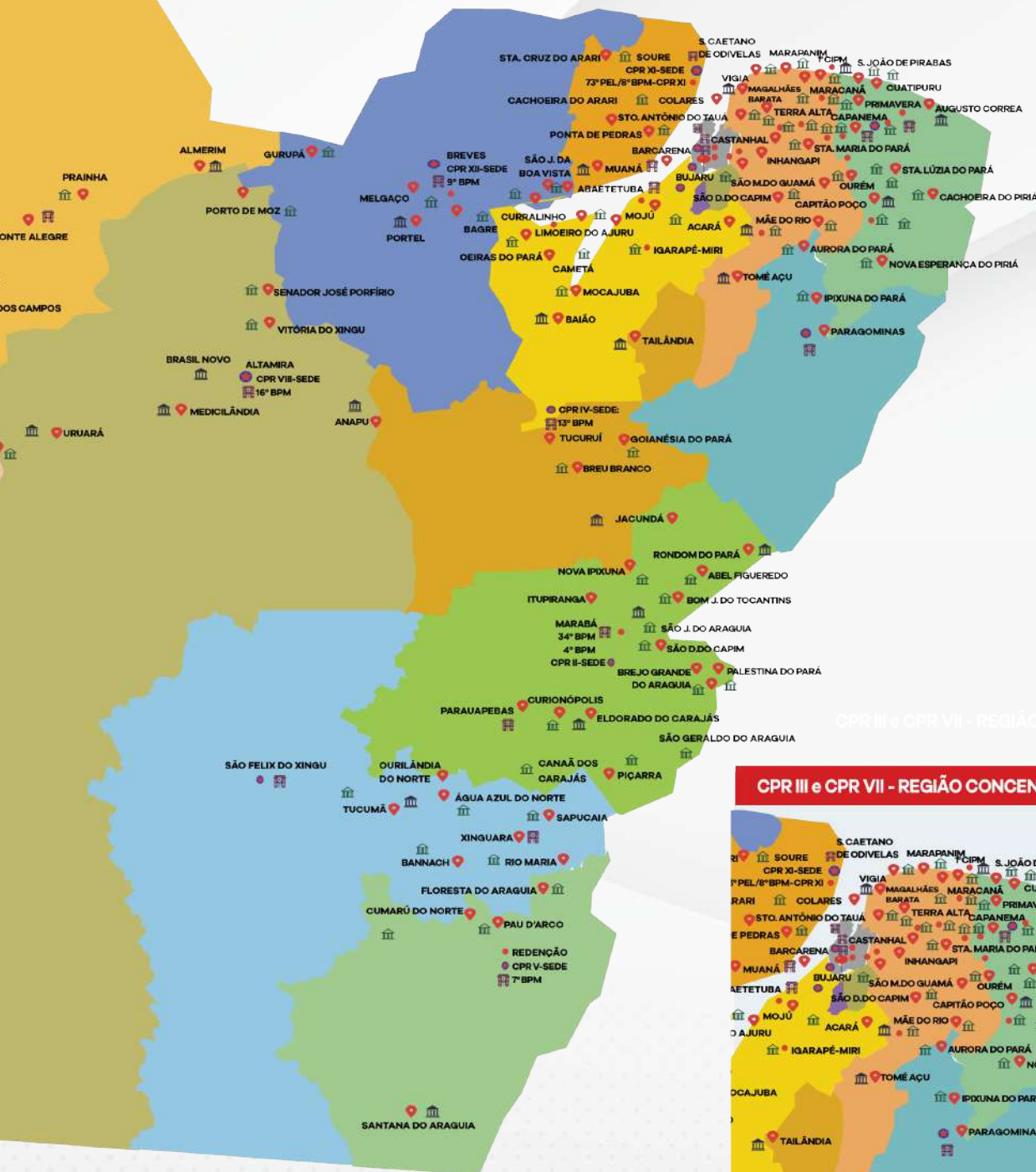
CPR III e CPR VII - REGIÃO CONCENTRADA