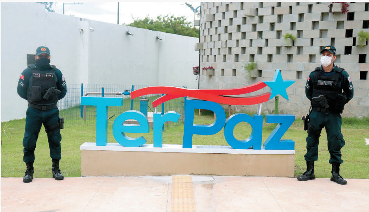
Policimento na Usina da Paz.

Segundo a Agência Pará, seis dos sete bairros atendidos não demonstram aumento dos Crimes Violentos Letais Intencionais (CVLI) que envolvem homicídio, latrocínio e lesão corporal seguida de morte, como por exemplo no Jurunas, Terra Firme e o Centro de Marituba que alcançaram a redução de 100% ao comparar o período de 1º a 20 de maio dos anos de 2020 e 2021. No Guamá, a queda foi de 25% no mesmo período.