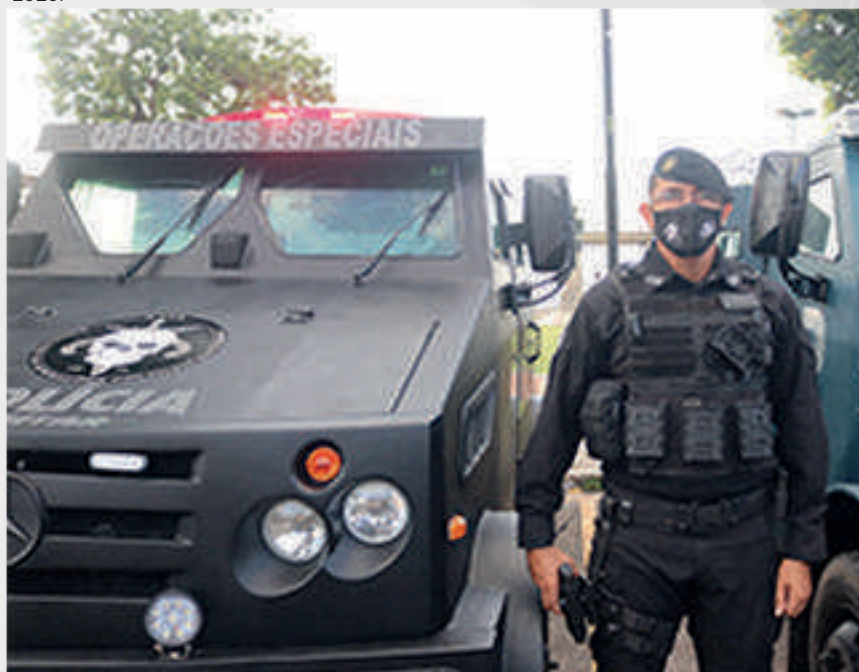
Carro blindado do BOPE incorporado à frota da PMPA em 2020.