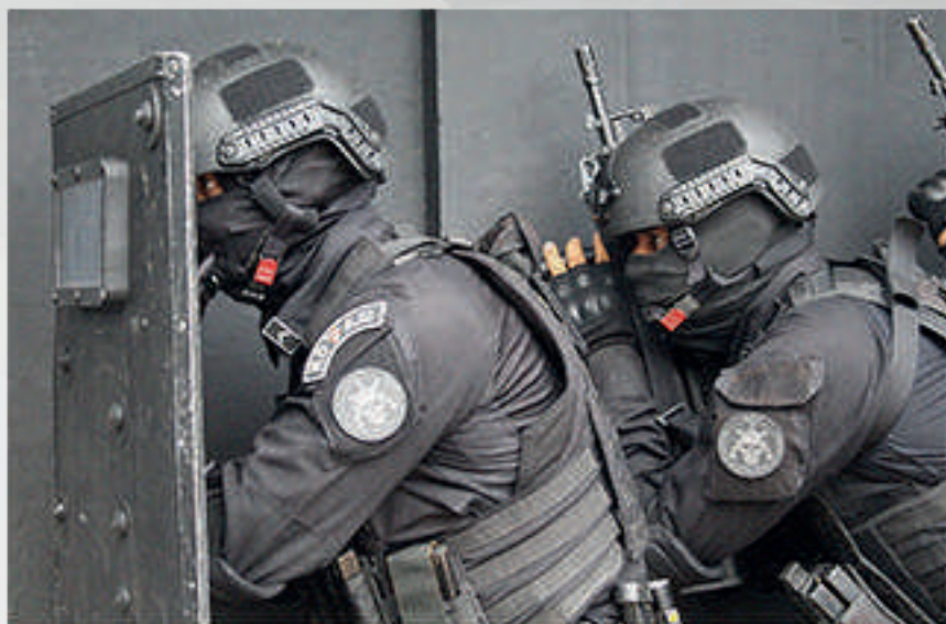
Policiais do Batalhão de Operações Policiais Especiais (BOPE) em treinamento. Belém/PA, 2020.