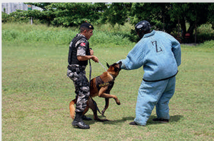
Policiais do Batalhão de Ações com Cães (BAC) em treinamento. Belém/PA, 2020.