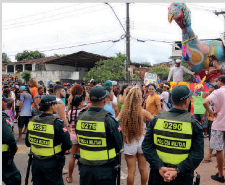
Policamento durante a Operação Carnaval no Distrito de Outeiro, em 2020.

Estão diretamente subordinados ao DGO os Comandos Operacionais Intermediários (COInts). Ao todo, são treze comandos regionais (CPRs) no interior do Estado e seis comandos especializados na capital: CME, CPA, CPE, CPRM, CPC I e CPC II. Cada COInt tem diretamente subordinados a ele Batalhões (BPM) e Companhias Independentes de Polícia Militar (CIPM).