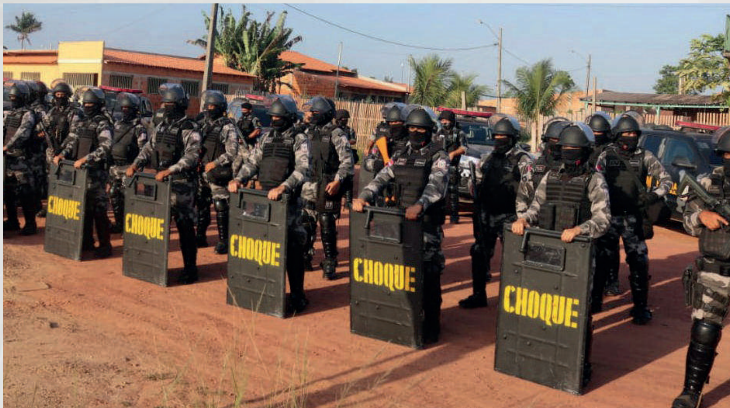
Batalhão de Choque em operação de reintegração de posse no interior do Estado, 2020.

O controle e apoio direto nos processos de reintegrações de posse, através dos Comandos Intermediários, também fazem parte das atribuições do Departamento-Geral de Operações. A tabela ao lado demonstra os seguintes cumprimentos de mandados judiciais nos anos 2019 e 2020.