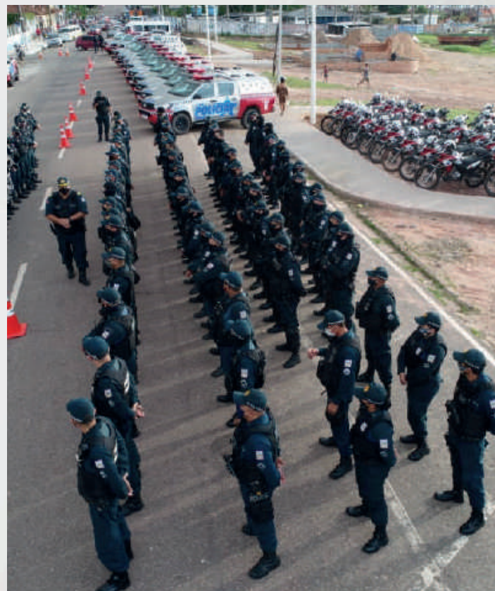
Operação Overlord no Distrito de Icoaraci, Belém-PA, 2020.

Durante as ações, foram empregadas na Região Metropolitana de Belém 1.422 policiais militares e 605 meios de policiamento, entre viaturas, motocicletas e cavalos nessa região. No interior do Estado, foram empregados 2.143 militares e 899 meios de policiamento, somando um total de 1.504 meios de policiamento e 3.565 policiais militares.