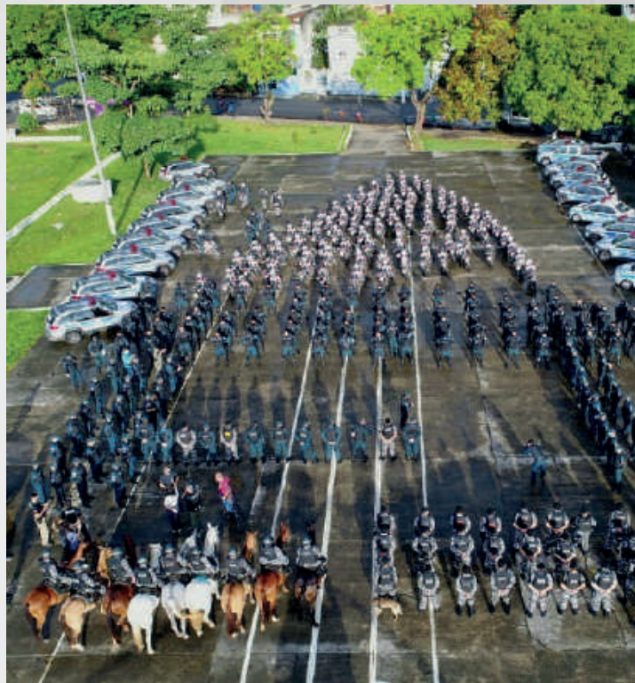
Operação Festas Seguras, Belém-PA, 2019.

As ações de policiamento ostensivo foram realizadas nos locais onde foi identificada a maior necessidade de reforço da PM, visando reduzir os índices de criminalidade. Devido ao sucesso da Operação Overlord, que resultou no aumento da sensação de segurança da população, foram deflagradas mais duas operações no mesmo formato.