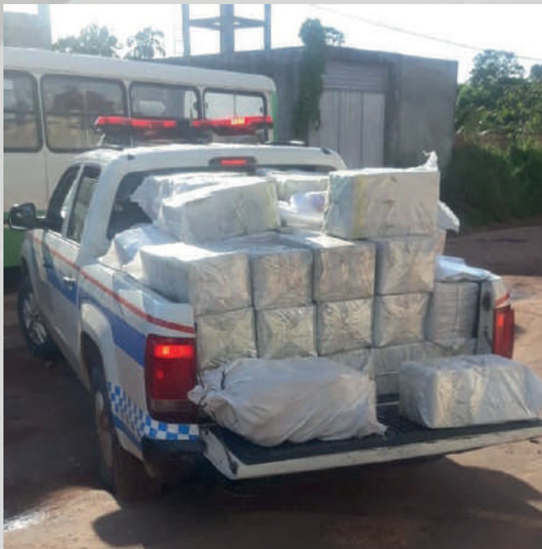
Maiores apreensões de cocaína no Estado, Barcarena/PA, 2020.

A PMPA vem desarticulando diversos grupos criminosos, como os que atuam com a comercialização de entorpecentes. Ao todo, mais de 2 toneladas de cocaína e mais de 1 tonelada de maconha foram apreendidas pela PMPA, somente em 2020.