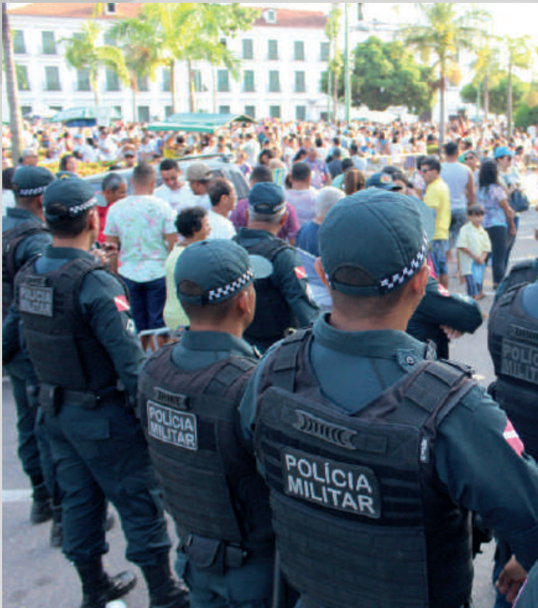
Policiamento durante o Círio de Nazaré, Belém-PA, 2019.