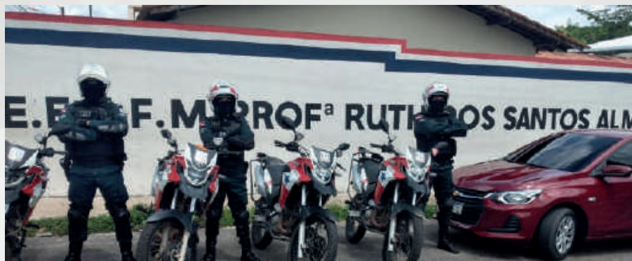
Operação Enem, 2020.

A participação da PM em todos os momentos assegura o sucesso da logística, assim como a lisura de aplicação mediante a escolta de provas e o apoio aproximado com o policiamento para que os alunos possam realizar o certame com tranquilidade e segurança.