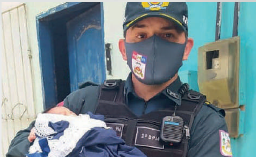
Comandante do 2º BPM, com o bebê resgatado a ser entregue à mãe, Belém, 2020.

Uma ocorrência em que houve destaque na atuação da Polícia Militar ocorreu no ano de 2020, quando um bebê que havia sido sequestrado da Fundação Santa Casa de Misericórdia do Pará, no bairro do Umarizal, em Belém, foi encontrado pelos policiais no Distrito de Icoaraci. Por volta das 3h40 da madrugada de 23 de junho, um dia após o nascimento, a criança havia sido sequestrada do hospital.